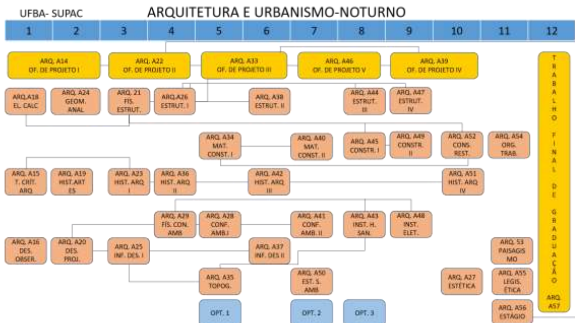
Figura 3 - Estrutura Curricular do curso noturno de AU da UFBA